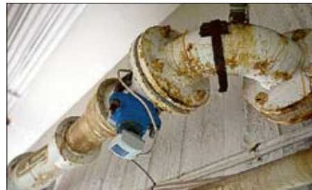
Rostiga rör. Under Kristiansborgsbadets stora bassäng ser det ut så här.