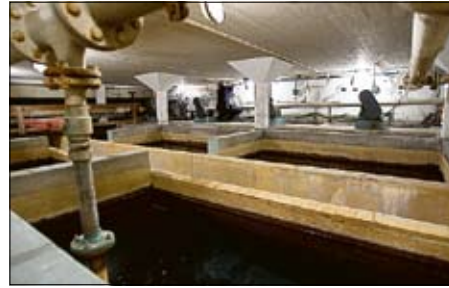
Här renas vattnet. I öppna sandfilter. Kristiansborgsbadets reningsanläggning är inte dimensionerad för beläggningen. Kokpunktens försening oroar miljö- och hälsa som kräver täta vattenkontroller.